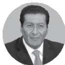
CARLOS PAREDES RODRÍGUEZ, EX MINISTRO DE TRANSPORTES Y COMUNICACIONES

FORO POLÍTICAS PÚBLICAS PARA INFRAESTRUCTURA, VIVIENDA Y CONSTRUCCIÓN